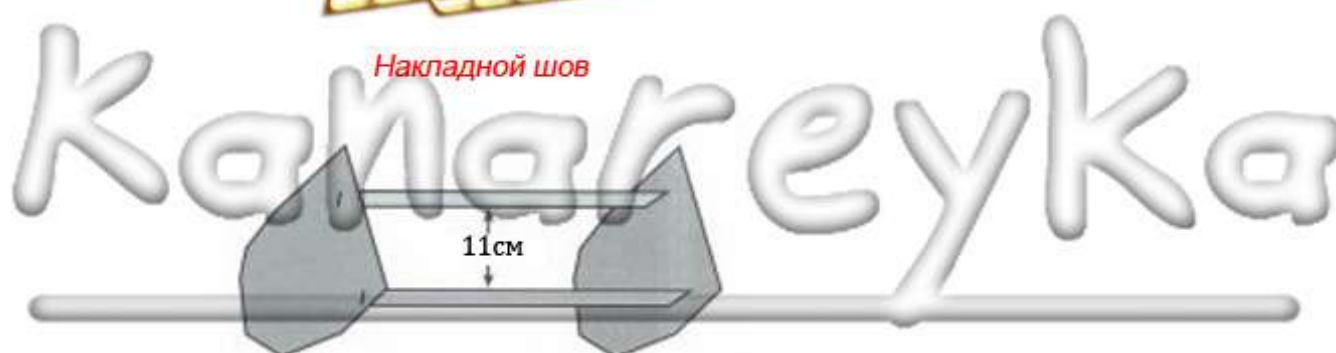
Схема для сборки