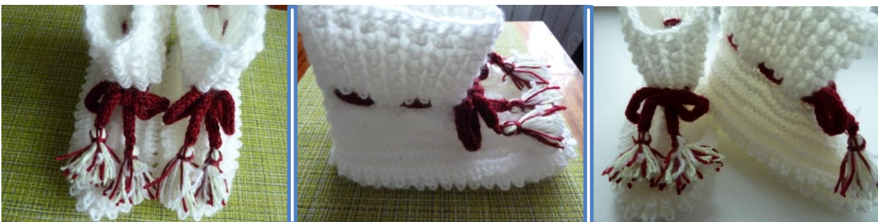
(Фото 29, 30, 31, Сапожки)

Второй сапожок вяжется аналогично первому.