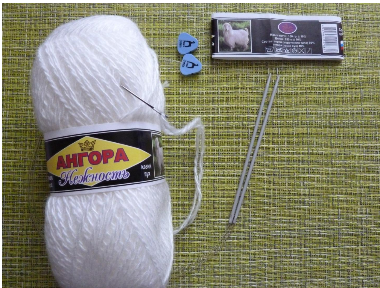
(Фото 1, Материалы для сапожков)

Для веревочки потребуются другие материалы (можно использовать те же, что и для сапожков, но тогда веревочка получится слишком крупная и будет не так изящно смотреться, так же можно использовать в качестве веревочки уже готовую тесьму или атласную ленту):