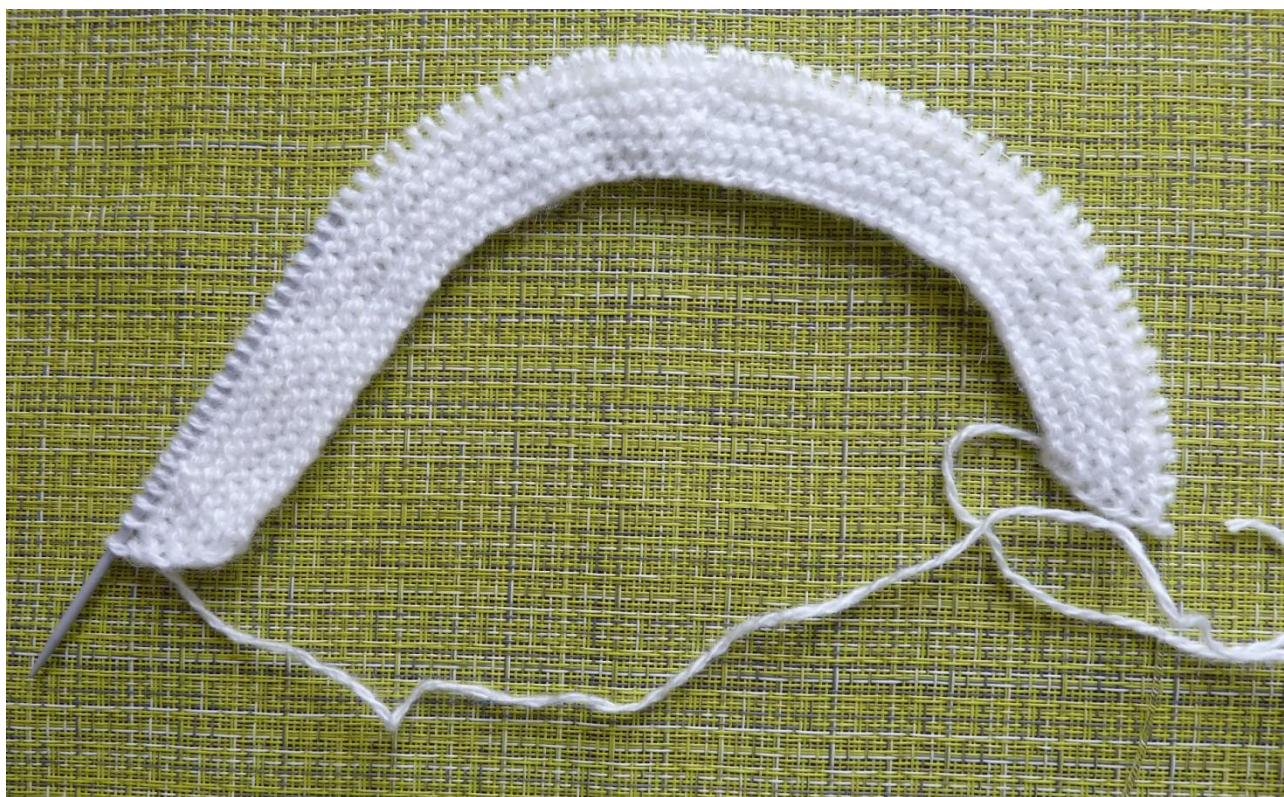
(Фото 7, Подошва)