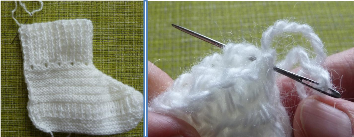
(Фото 25, 26, Сборка сапожка)

Сложить связанную деталь сапожка пополам лицевой стороной внутрь и сшить с помощью иглки с большим ушком.