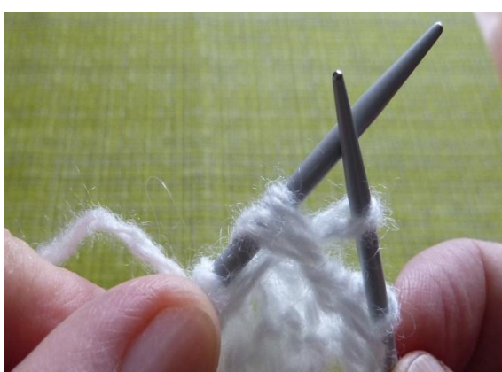
(Фото 11, петля с 2-мя накидами, провязанная изнаночной петлей)

13-й ряд: кромочная, *1 лицевая петля, 1 петлю с 2-мя накидами провязать изнаночной петлей*, от * до * повторять до конца ряда, кромочная.