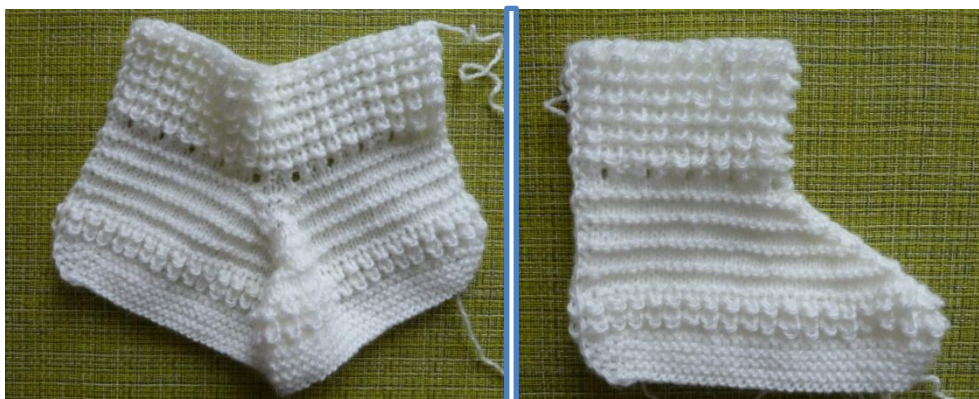
(Фото 19, 20, Связанная деталь сапожка)

62-й ряд: закрыть все петли и оставить нить для сшивания около 75 см.