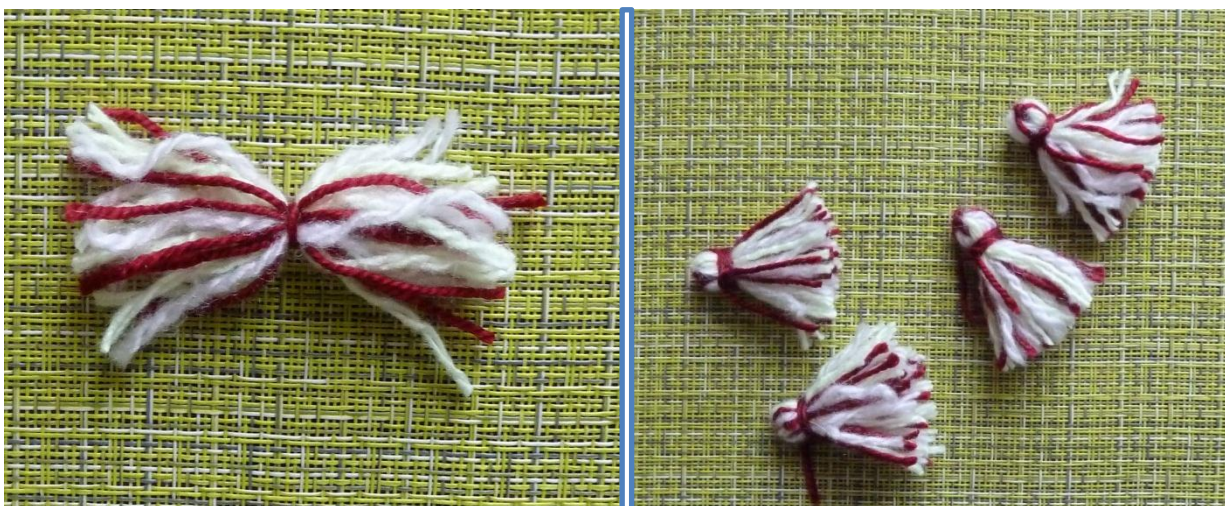
(Фото 23, 24, Кисточки)

Намотать пряжу разных цветов (по желанию) на широкую линейку, например, обрезать с одного края, и по середине, несколько раз обмотав нитью туго завязать. Затем сложить пополам и завязать нитью сверху, отступив немного от верхушки чтобы получился небольшой «шарик».