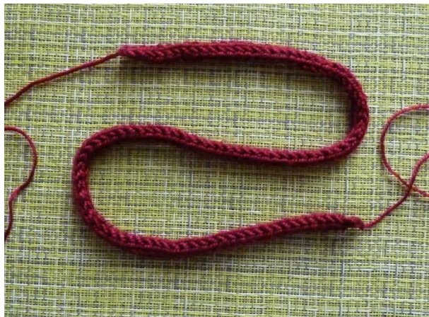
(Фото 22, Веревочка)

Нить у веревочки оставить для того, чтобы потом пришить кисточки.