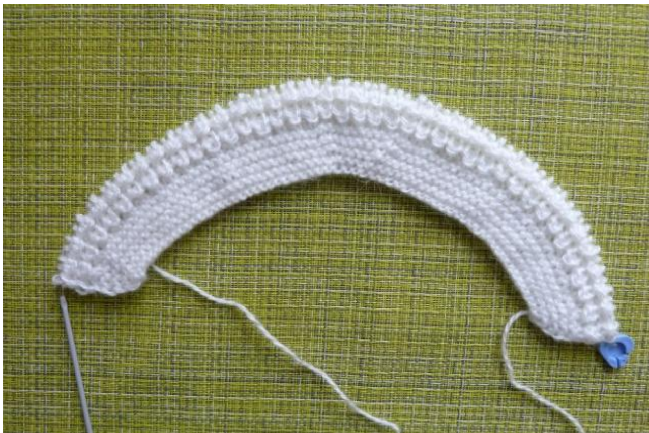
(Фото 12, Количество провязанных рядов равно 17)

18-й ряд: кромочная, 36 лицевых петель, 2 петли провязать вместе лицевой петлей, 2 лицевые петли, 2 петли провязать вместе лицевой петлей, 36 лицевых петель, кромочная.