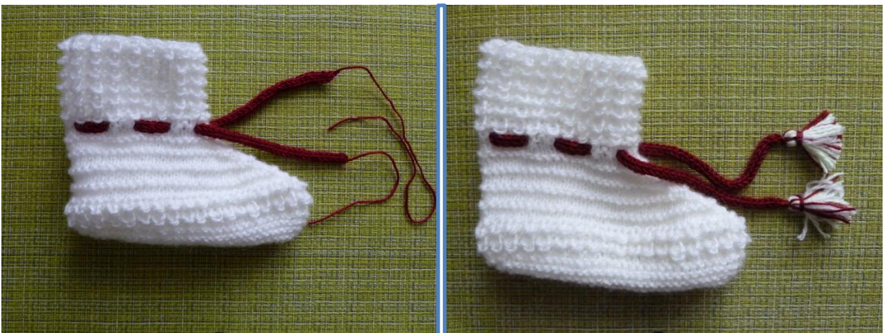
(Фото 27, 28, Как продеть веревочку и пришить кисточки)

В накиды 37-го ряда вставить веревочку и пришить кисточки.