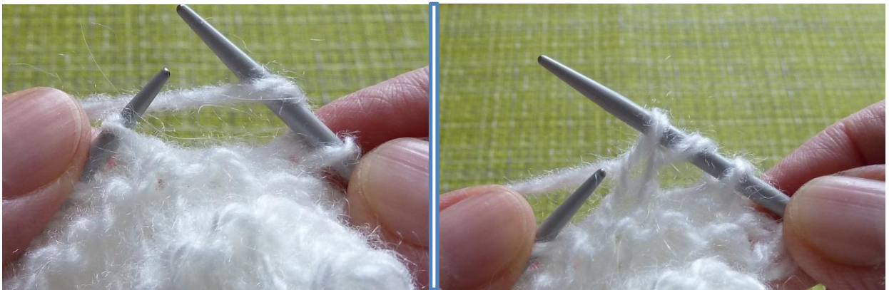
(Фото 15, 16, Накид)

37-й ряд: кромочная, *2 петли провязать вместе лицевой петлей, 1 накид, 2 лицевые петли*, от * до * повторять до конца ряда, кромочная.