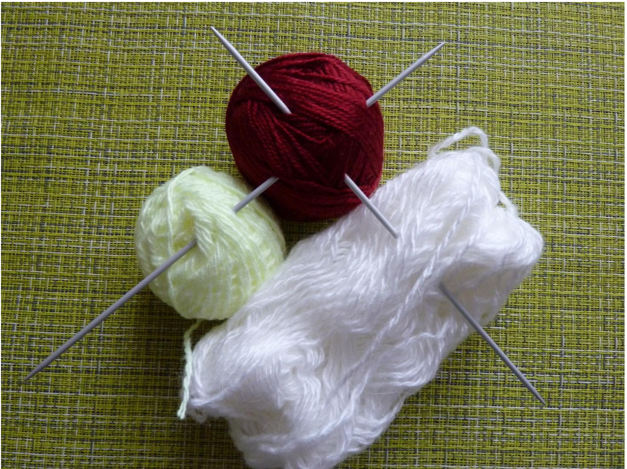
(Фото 2, Материалы для веревочки)