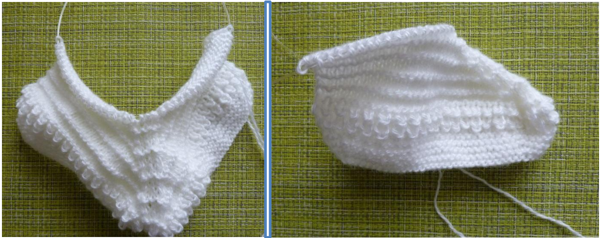
(Фото 13, 14, Передняя, задняя и носочная часть, количество провязанных рядов равно 36)