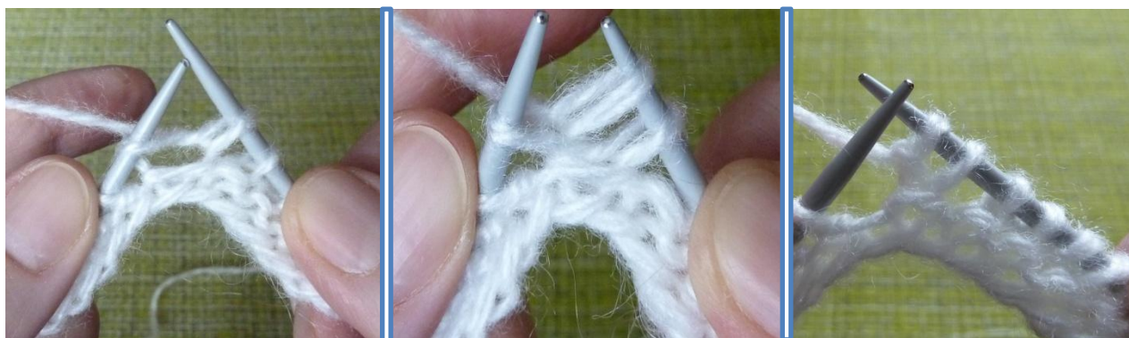
(Фото 4, 5, 6, Как из одной петли провязать 2 лицевые петли)

2-й ряд: кромочная, из одной петли провязать 2 лицевые петли (сначала провязать лицевую петлю за передние стенки петли, которая находится на левой спице и, не снимая ее со спицы провязать еще одну лицевую петлю, но уже за задние стенки все той же петли), 28 лицевых петель, из одной петли провязать 2 лицевые петли, 2 лицевые петли, из одной петли провязать 2 лицевые петли, 28 лицевых петель, из одной петли провязать 2 лицевые петли, кромочная.