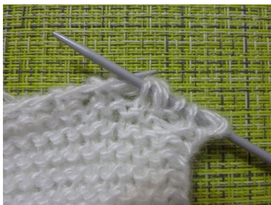
(Фото 10, Накид и петля с накидом с предыдущего ряда)

12-й ряд: кромочная, *1 петлю с предыдущего ряда с накидом снять не провязанной и сделать еще один накид, 1 лицевая петля*, от * до * повторять до конца ряда, кромочная.