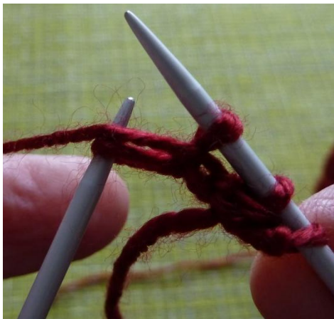
(Фото 21, Как снять петлю, чтобы нить находилась перед петлей)