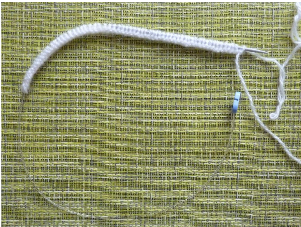
(Фото 3, Набор петель)

1-й ряд: кромочная, остальные петли провязать лицевыми петлями.